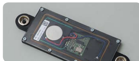
IP-Schutzklasse 65: kein Eindringen von Wasser in die Technik bei Reinigung oder Inkontinenz