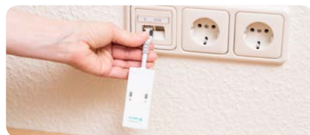
Einfache und schnelle Installation – Birntaster kann parallel genutzt werden