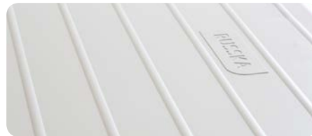
Rutschsichere Mattenoberfläche und Mattenunterseite sowie leicht zu reinigende Materialität