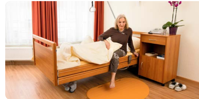
1. Die Patientin wird unruhig und möchte aufstehen. Mit dem Betreten der Matte, löst sie Alarm aus – ab jetzt ist die Pflegefachkraft über die Aufstehabsicht informiert.

Für das Pflegepersonal ist z. B. die Betreuung von Demenzpatienten eine besondere Herausforderung. Die Funk-Sensormatte von RUSSKA ist das ideale Hilfsmittel, um Pfleger sofort über das Weglaufen oder über Stürze zu informieren. Somit können Risiken in der Pflege vermindert und die Pflege-Kapazitäten effizient und zielgerichtet eingesetzt werden.