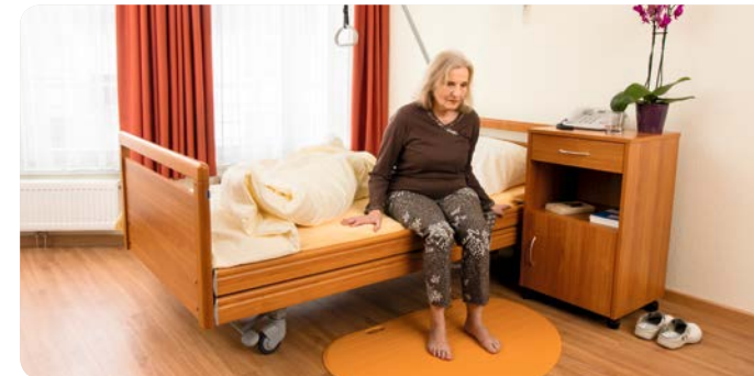
2. Die Patientin sitzt bereits und möchte gerade aufstehen.