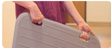
Tragegriffen ermöglichen leichte Handhabung beim Umplatzieren