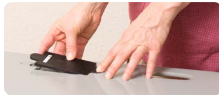
Herausnehmbares Sendergehäuse ermöglicht leichten Batteriewechsel und Versand bei technischen Problemen